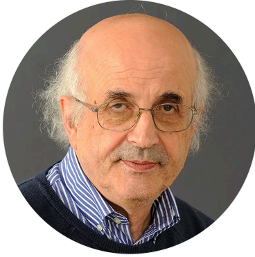
Flavio Fogarolo Autore